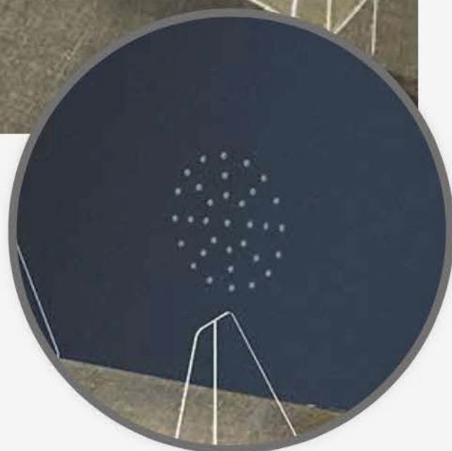
Avec ou sans perforations